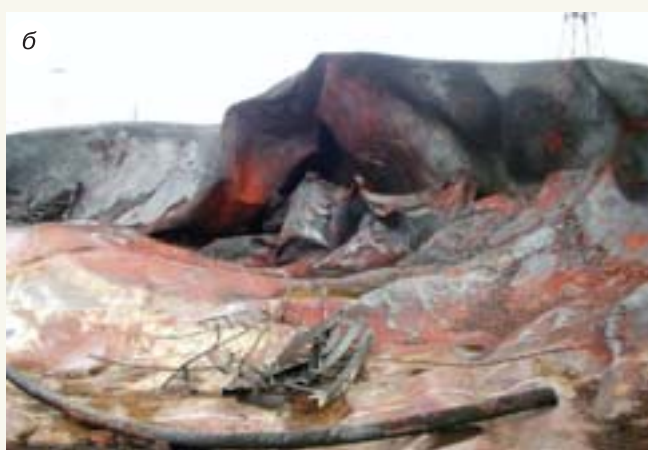
Рис. 1. Последствия аварии: а — взрыв резервуара; б — пожар

тов и ученых. Согласно официальному акту расследования причина возникновения аварийной ситуации — «обстоятельства непреодолимой силы малоизученного природного явления — грозовой разряд». Очень показательная формулировка: «Малоизученное природное явление». При этом в России трудятся одни из лучших в мире специалистов в области физики молний, работают профильные научные институты, издаются научные труды [2–5]. Несмотря на общую для российской науки проблему недостатка финансирования, отсутствие современной и дорогостоящей экспериментальной базы, ведутся исследования, заслуживающие высоких оценок мирового научного сообщества. Так, исследования российских ученых Э.М. Базеляна и Ю.П. Райзера по увеличению надежности молниезащиты использовались при подготовке стандартов по молниезащите Национальной Ассоциации Пожарной Безопасности (США) [6, 7].