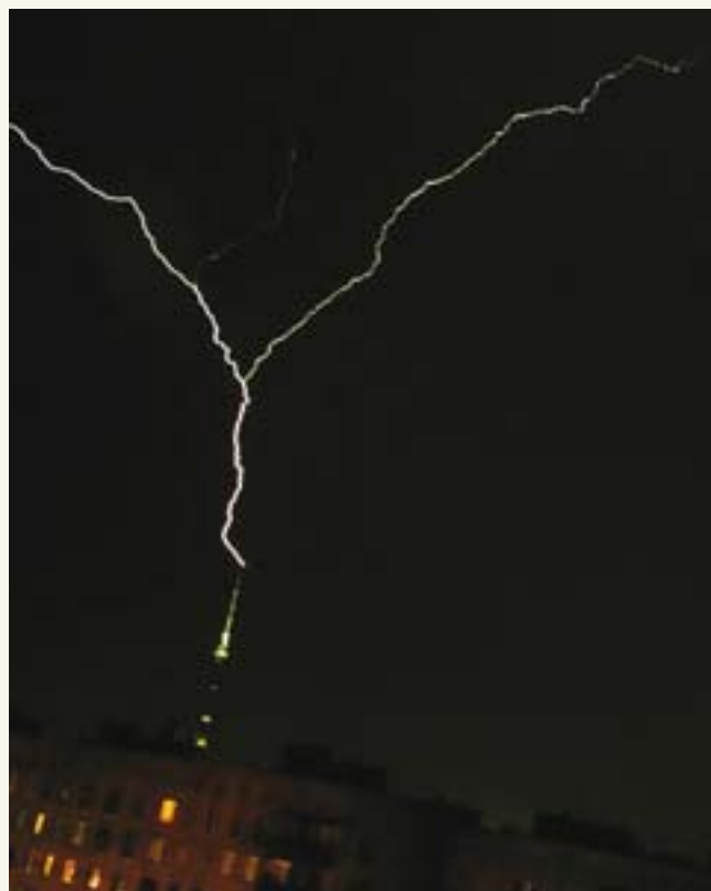
Рис. 2. Вид восходящей молнии

При анализе происшедшей аварии для резервуара была построена зависимость напряженности электрического поля на поверхности полосы ограждения крыши резервуара от высоты ограждения.